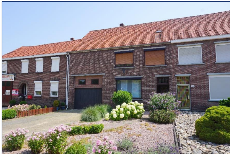
Koningsbosch, Prinsenbaan 129