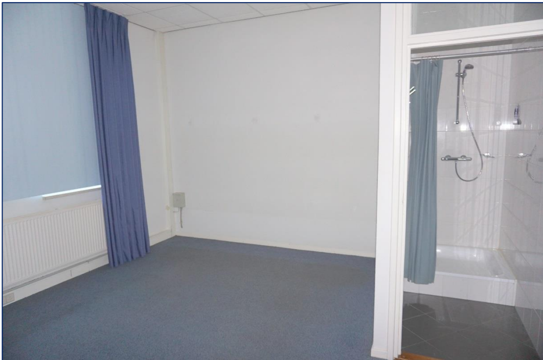
Kleedruimte met douche

Aan de in deze brochure verstrekte informatie kunnen geen rechten worden ontleend. Het is ook geen aanbod, maar bedoeld als een uitnodiging om in onderhandeling te treden