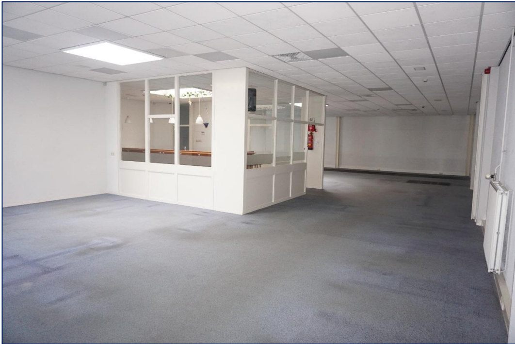
Bar en garderobe