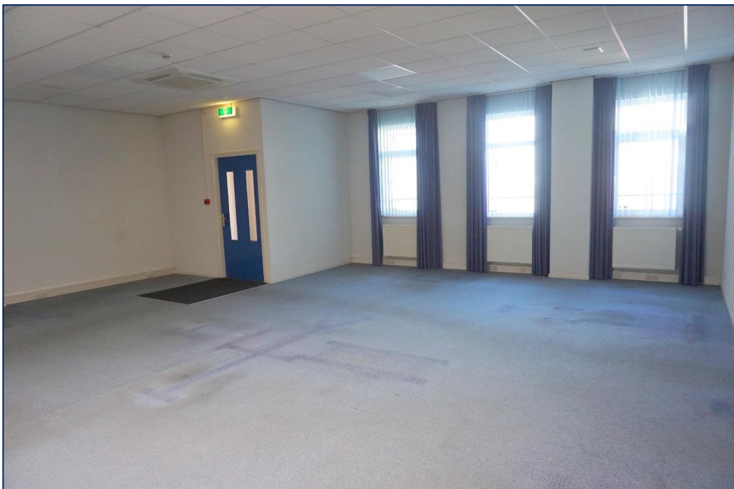
Entrée en bedrijfsruimte rechterzijde

Aan de in deze brochure verstrekte informatie kunnen geen rechten worden ontleend. Het is ook geen aanbod, maar bedoeld als een uitnodiging om in onderhandeling te treden