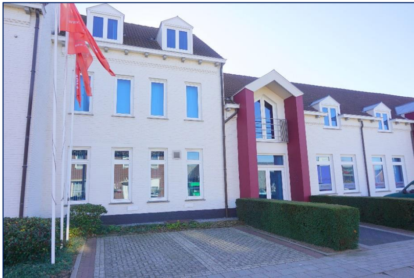
Echt, Pastoor Cramerstraat 2 k