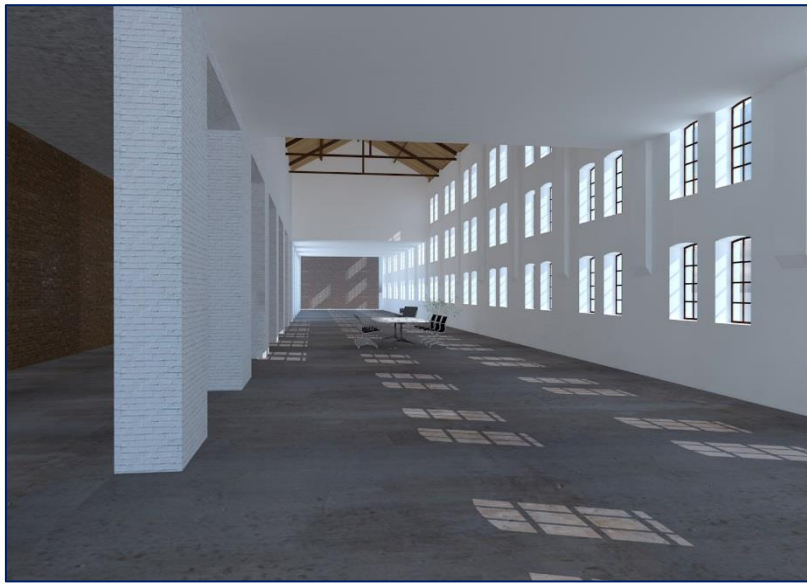
Echt, Aasterbergerweg 2 C