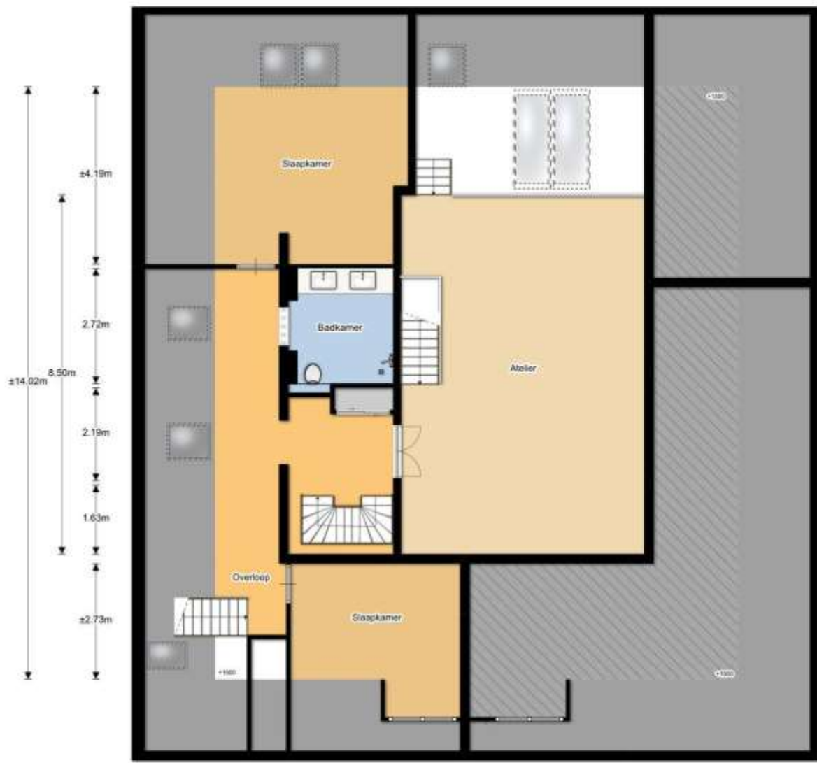
1e verdieping (Dorpsstraat 677)