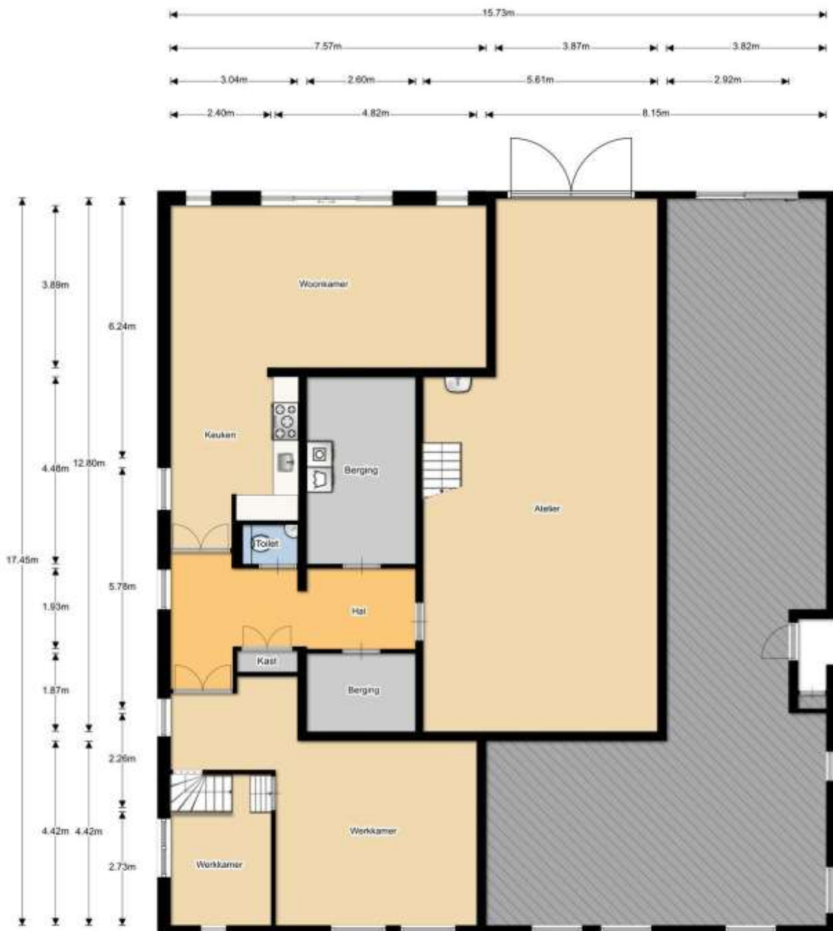
Begane grond (Dorpestraat 677)