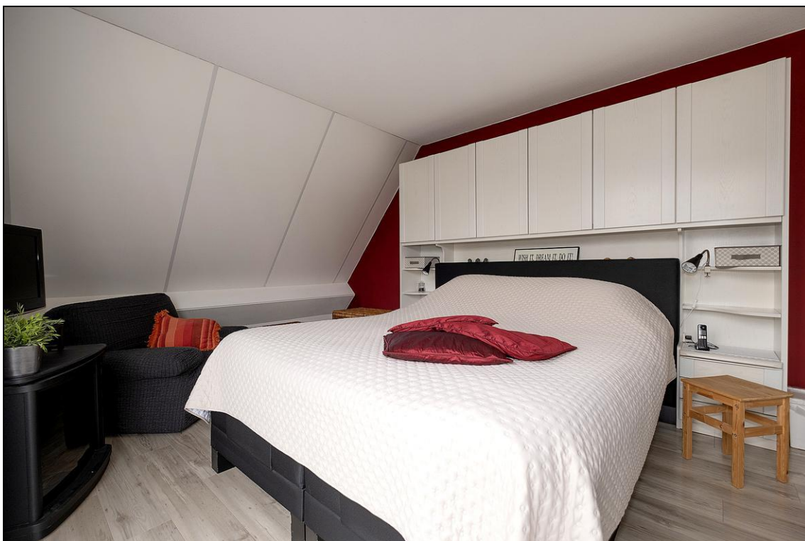
Opkamer 4 - 7854 SH Aalden

Uit de verkregen informatie van verkoper is deze brochure door ons met uiterste zorgvuldigheid samengesteld. Voor eventuele onjuiste of onvolledige informatie zijn wij niet aansprakelijk