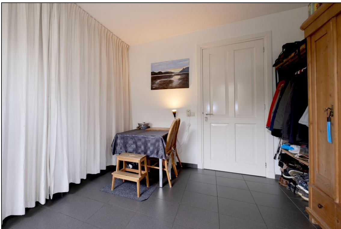
Opkamer 4 - 7854 SH Aalden

Uit de verkregen informatie van verkoper is deze brochure door ons met uiterste zorgvuldigheid samengesteld. Voor eventuele onjuiste of onvolledige informatie zijn wij niet aansprakelijk