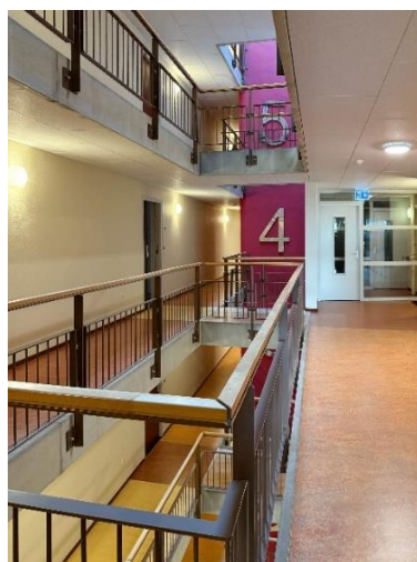
Lichtstraat 137, 5611 XD Eindhoven