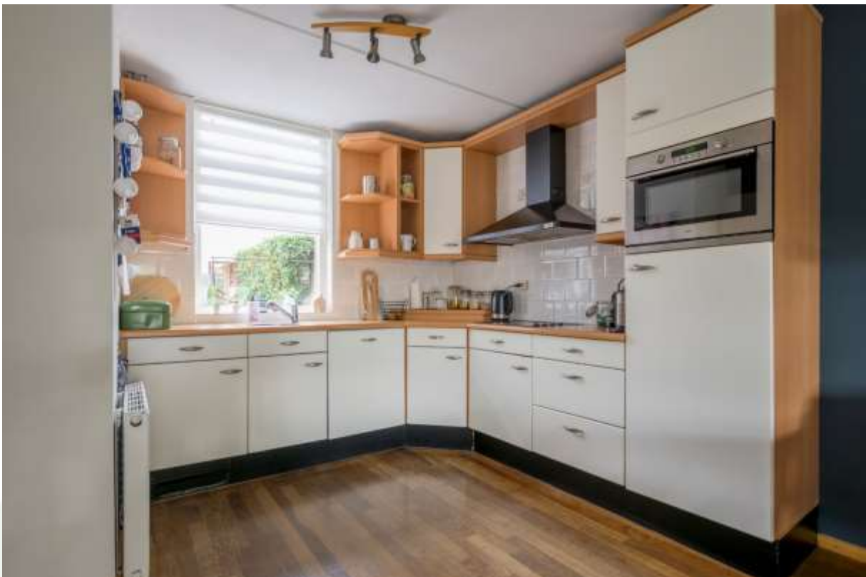
Open keuken aan de achterzijde gesitueerd