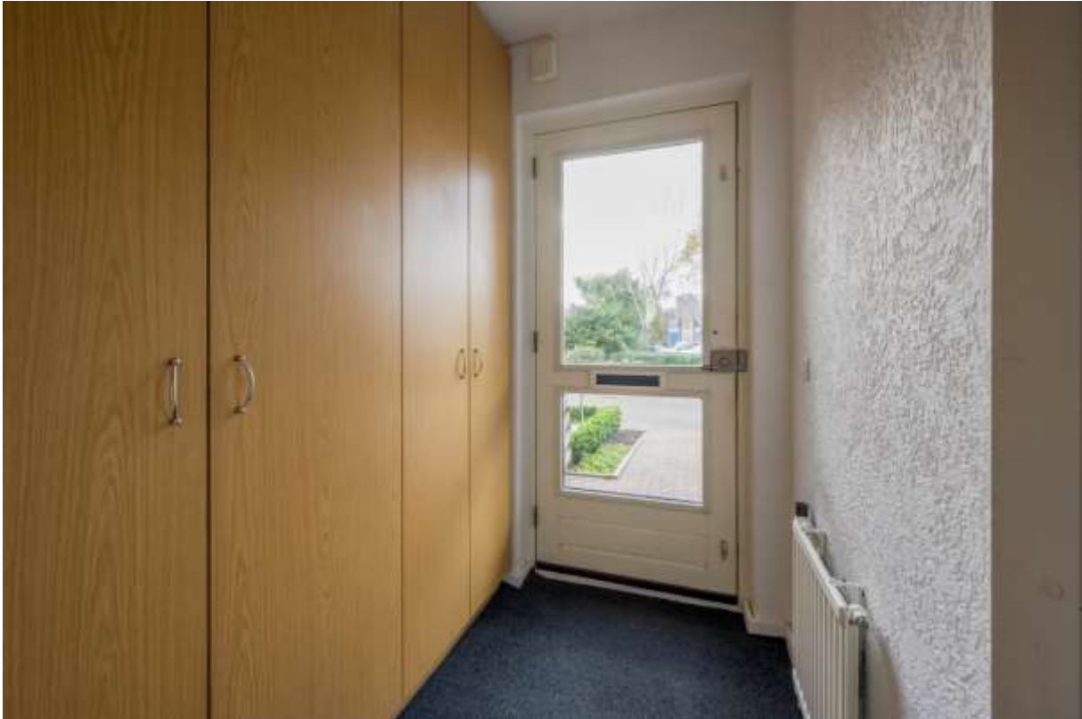
Entree/Hal met vaste kastenwand