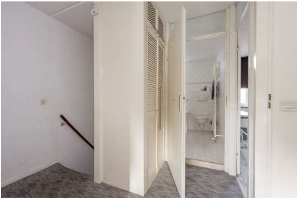
Overloop met vaste kast en trap naar de zolder