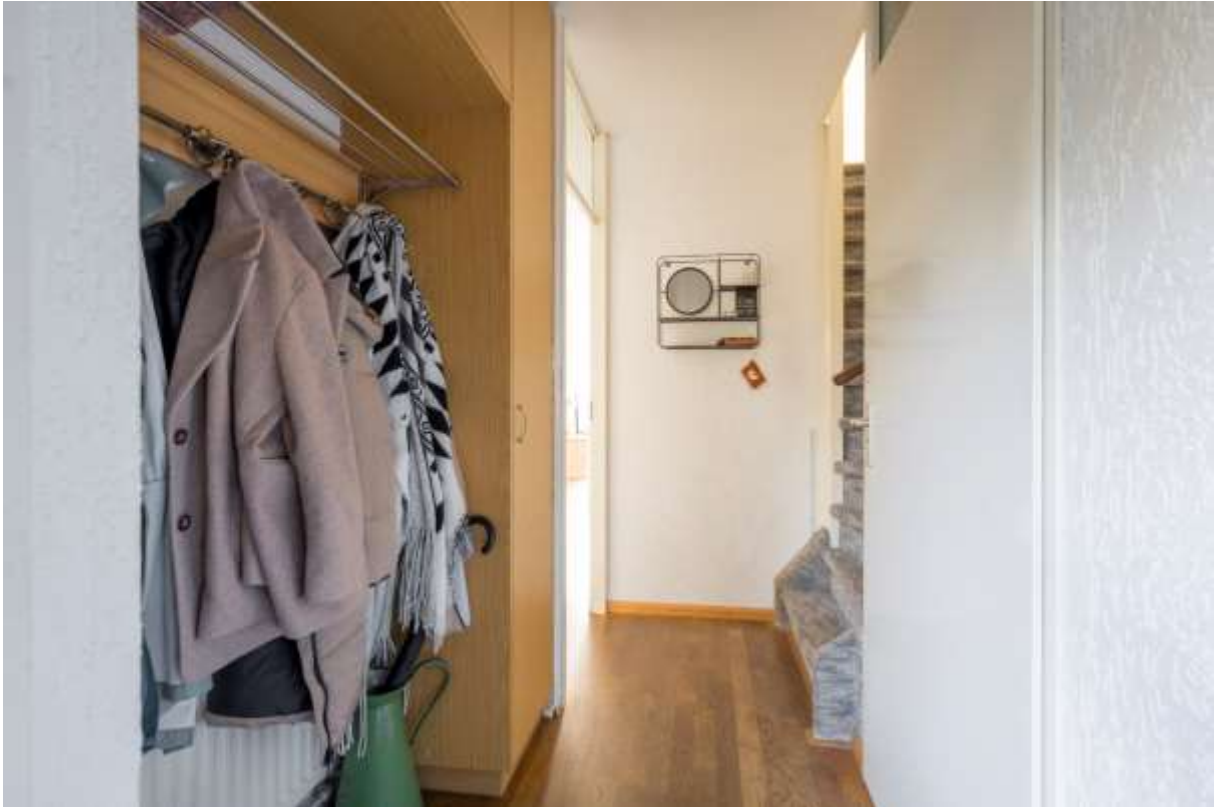
Tweede hal met garderobe, trapopgang, toilet