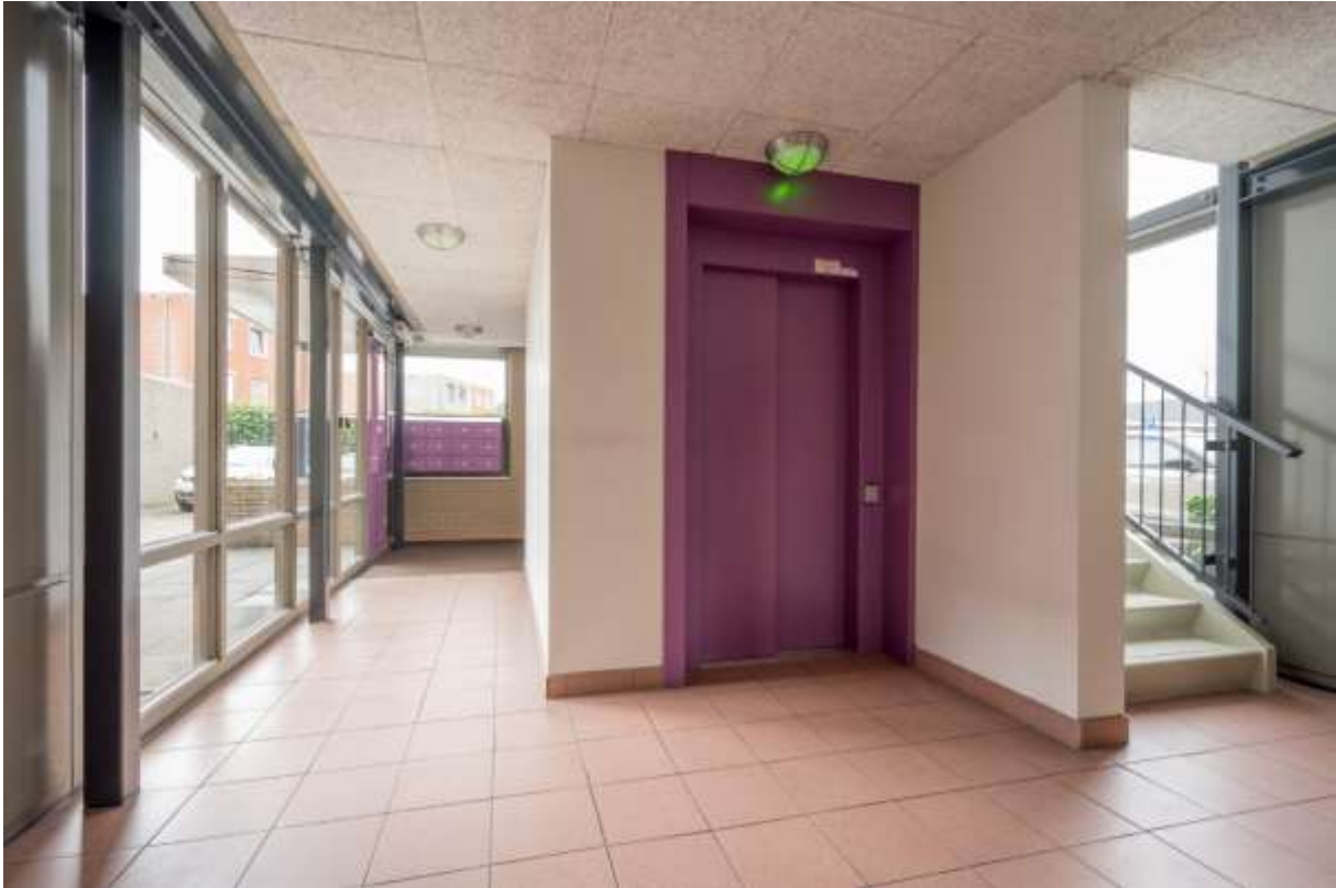
Centrale hal begane grond met lift en trapopgang