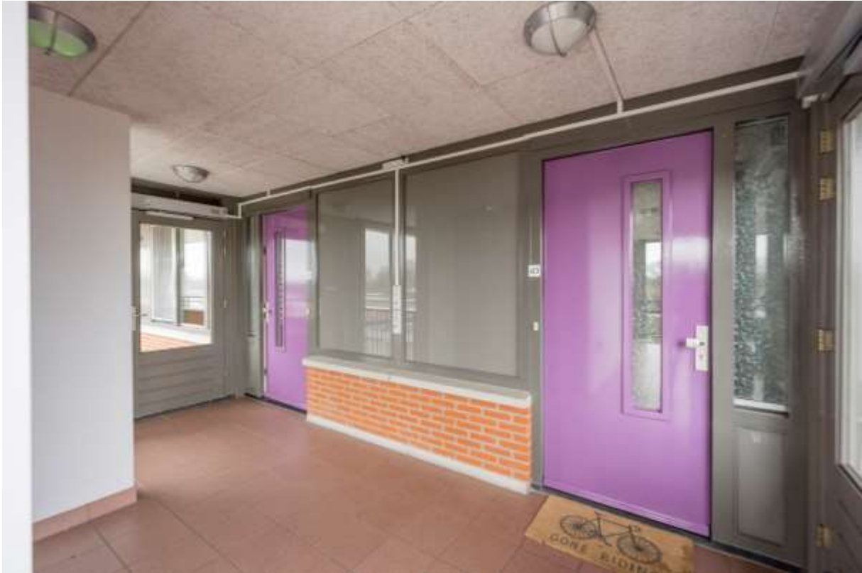
Centrale hal met toegang tot het appartement.