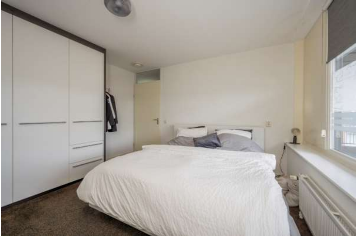
Slaapkamer met vaste kast