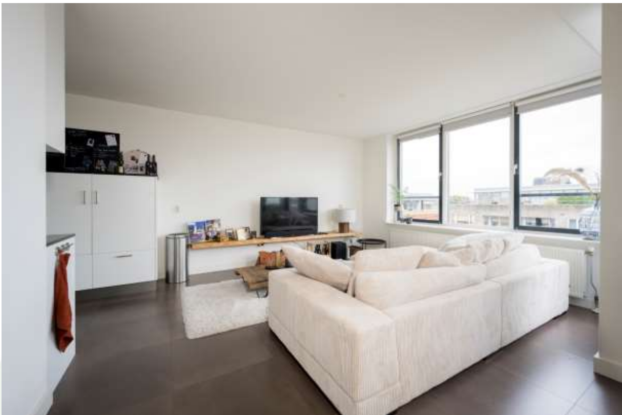
Woonkamer gesitueerd aan de voorzijde.