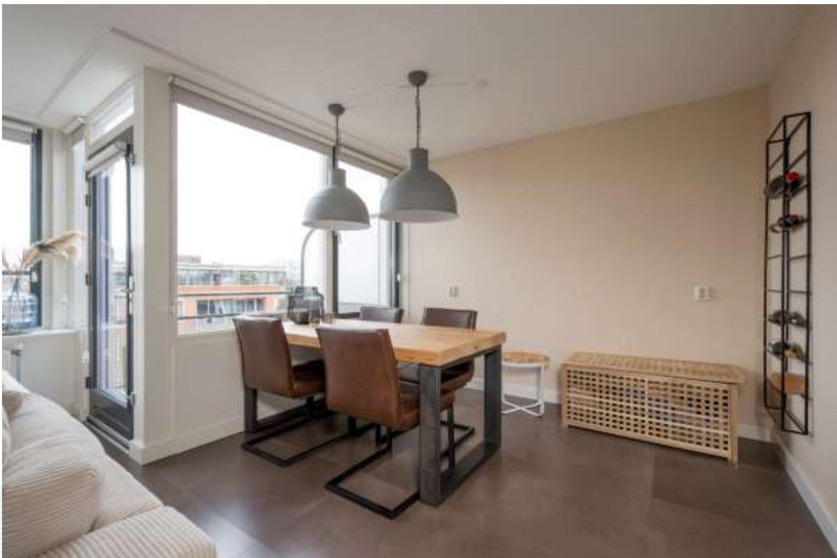
Eetgedeelte en toegang tot het balkon