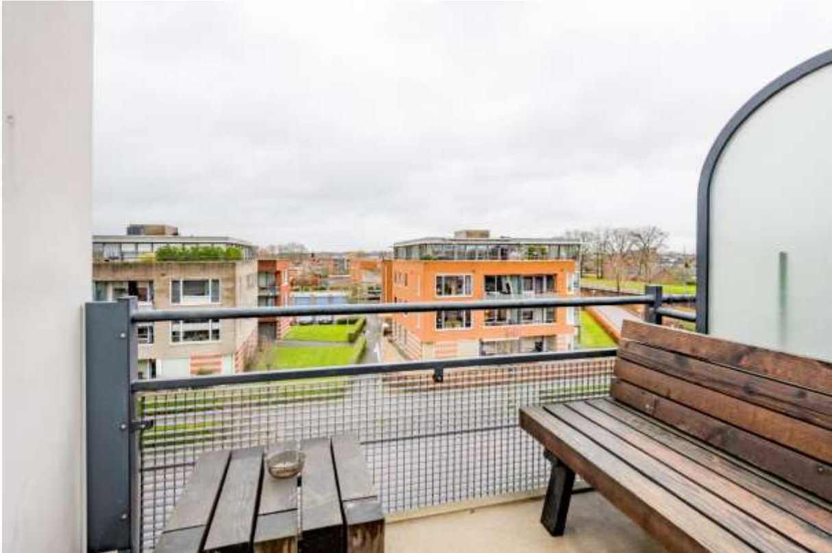
Balkon gesitueerd aan de voorzijde