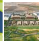
CLUBHOUSE & RESTAURANT