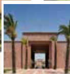
AL KASAR SHOPPING MALL & SUPERMARKET