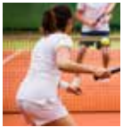
SPORT AREA & RESTAURANT