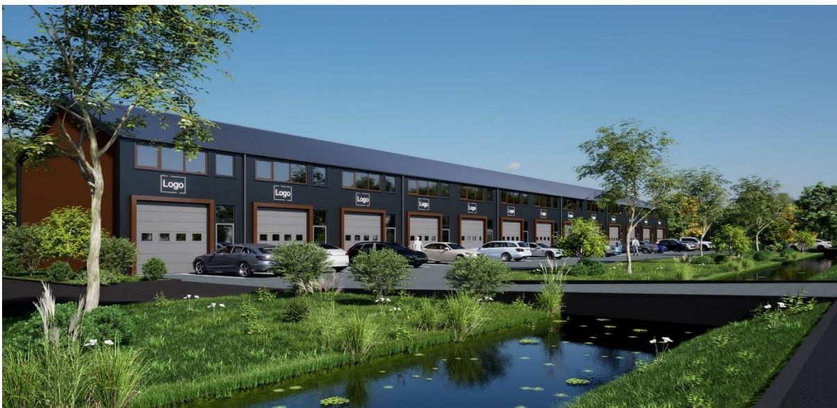
Impressie Voorgevel bedrijfsunits