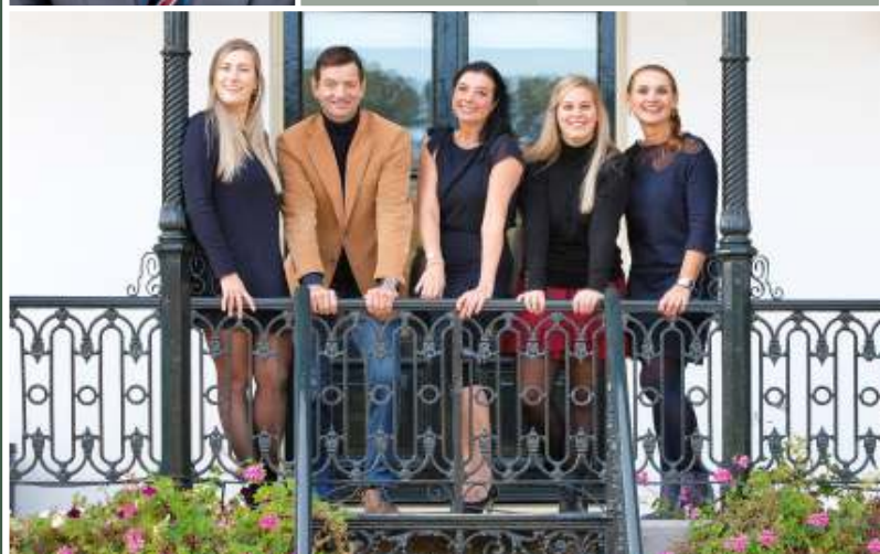
Team Bell Makelaardij B.V.

info@bellmakelaardij.nl | www.bellmakelaardij.nl