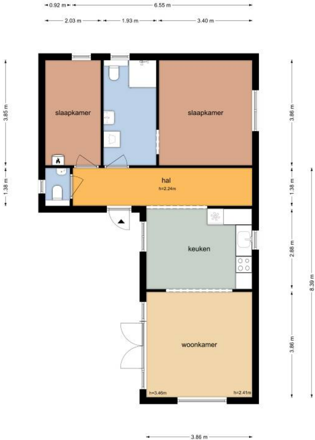
De Byvanck 5 - Beek Begane Grond

De plattegronden zijn geproduceerd voor promotionele doeleinden en ter indicatie. Aan de plattegronden kunnen geen rechten worden ontleend. © www.objectenco.nl