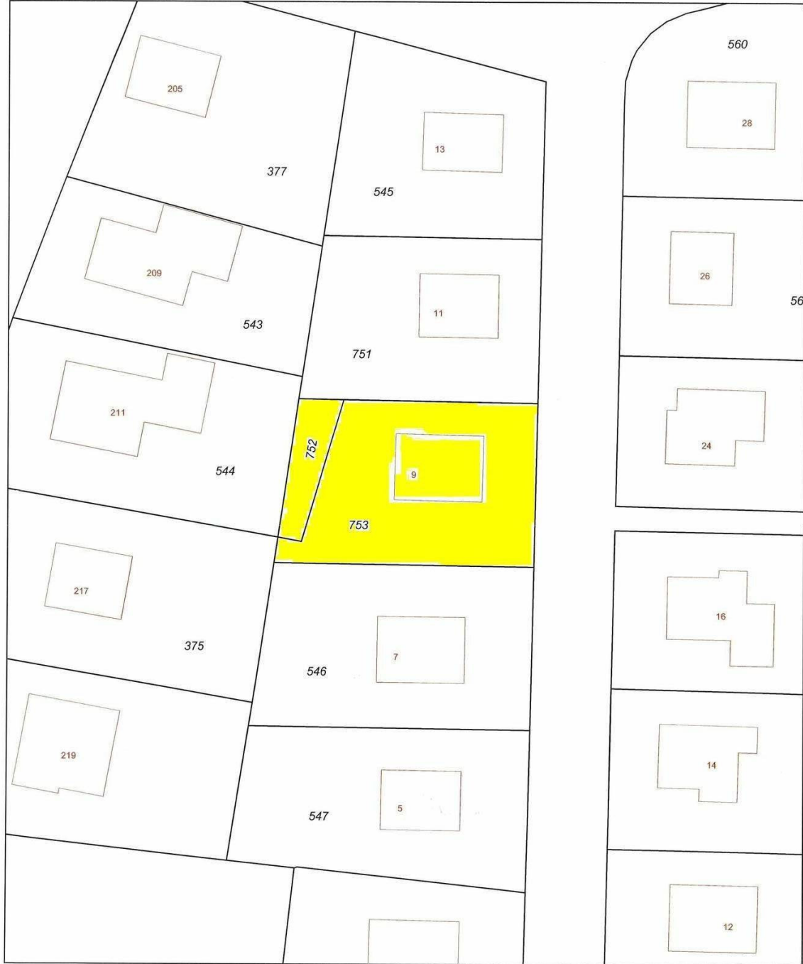
Uittreksel Kadastrale Kaart