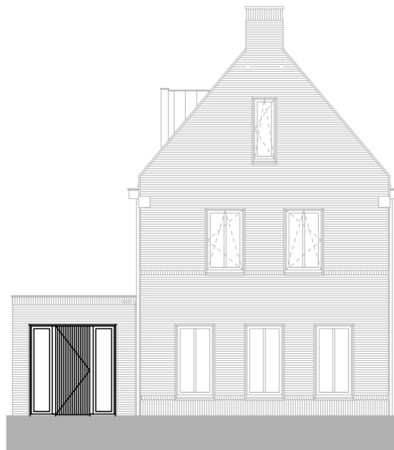
type B bouwnummer 12 voorgevel