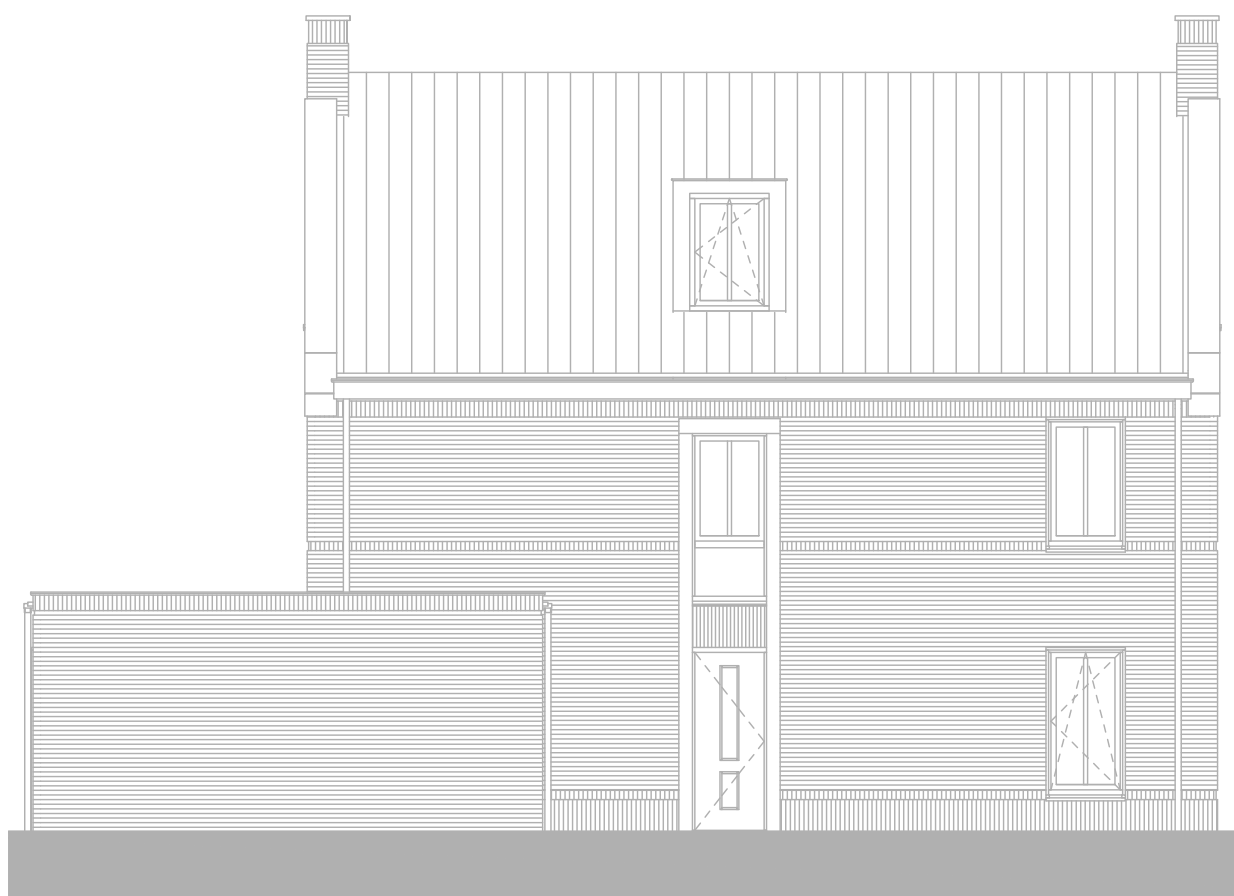
type B bouwnummer 12 linker zijgevel