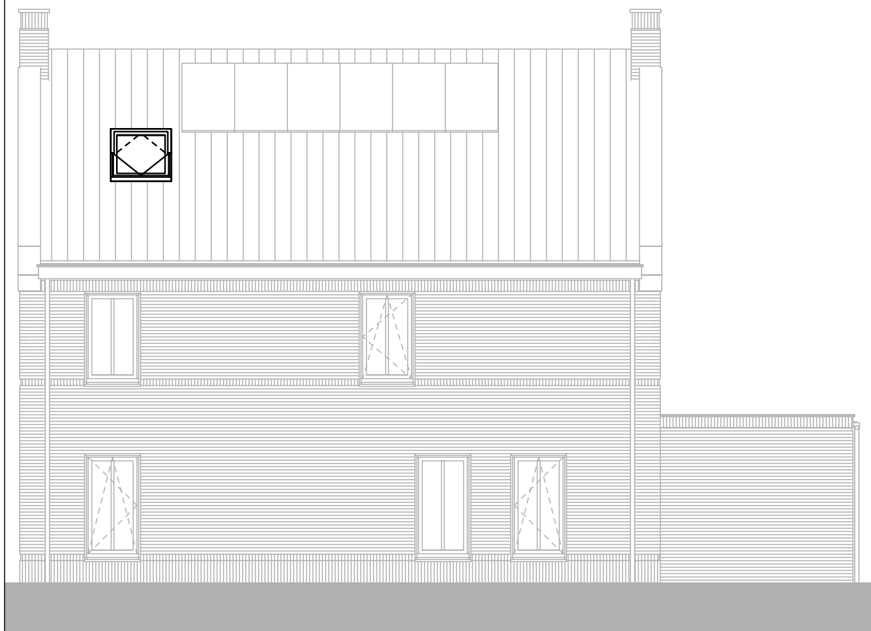
type B bouwnummer 12 rechter zijgevel