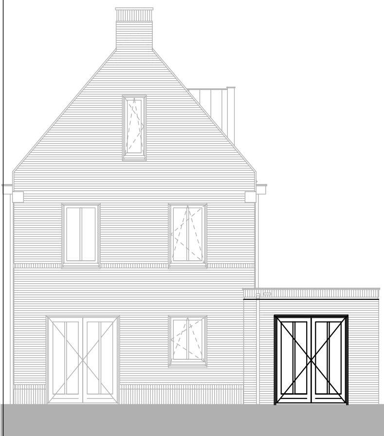
type B bouwnummer 12 achtergevel